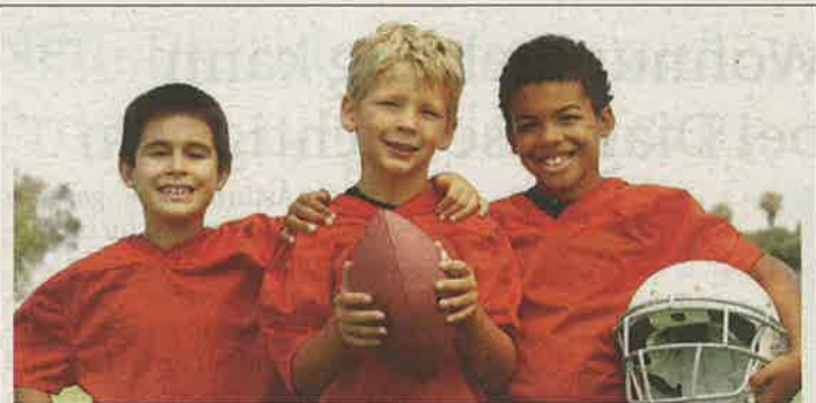
easyTherm bietet Unterhaltung für Groß und Klein. Nach dem Footballtraining kann man sich im Festzelt stärken.