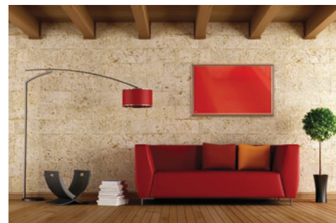
Jetzt Ihre alte Heizung durch eine moderne Infrarotheizung ersetzen (in Rot über dem Sofa)

Als qualifizierter Elektropartner erstellen die Stadtwerke kostenlos und unver-