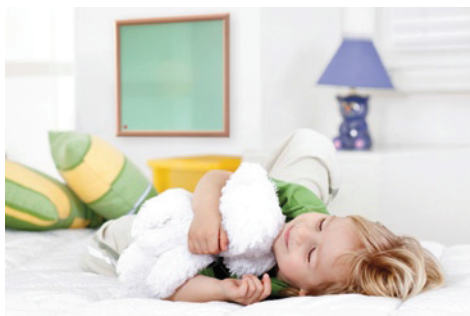
Gesund und sauber: Einfach wohlfühlen mit easyTherm (Infrarotheizung hier in Grün an der Wand)

Jeder dritte heimische Haushalt heizt mit einer Anlage, die älter als 20 Jahre ist (Quelle: Austrian Energy Agency), viel Geld zum Fenster hinaus. Viele schrecken vor einer Sanierung zurück, weil sie hohe Investitionskosten und aufwändige Umbauarbeiten befürchten. Das ist aber nicht der Fall, wenn man sich für Qualitäts-Infrarotheizungen entscheidet.