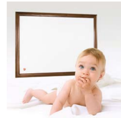
Behaglichkeit mit Infrarot-Heizungspaneele

zungen. Bei moderner Bauweise (z. B. Niedrigenergie- und Passivhäusern) und einer Heizlast unter 4 kW, rechnen sich konventionelle Heizsystem nicht und eine Infrarotheizung ist vorzuziehen.